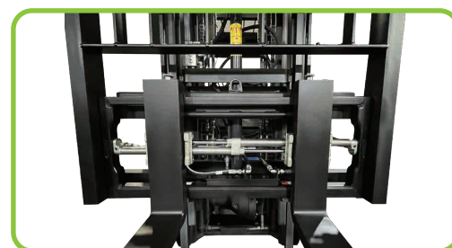
フォークポジショナー付きロードスタビライザー (オプション)